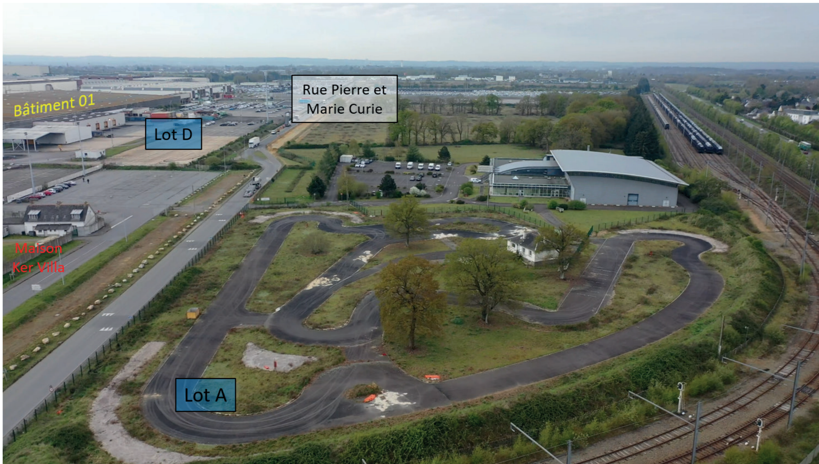
Figure 63 : Zone d'étude - Etat initial - 3 - Juin 2021