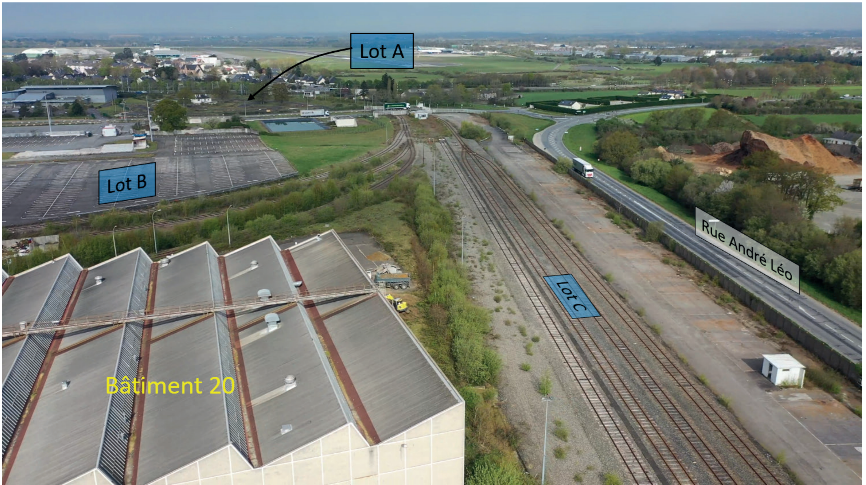
Figure 62 : Zone d'étude - Etat initial - 2 - Juin 2021