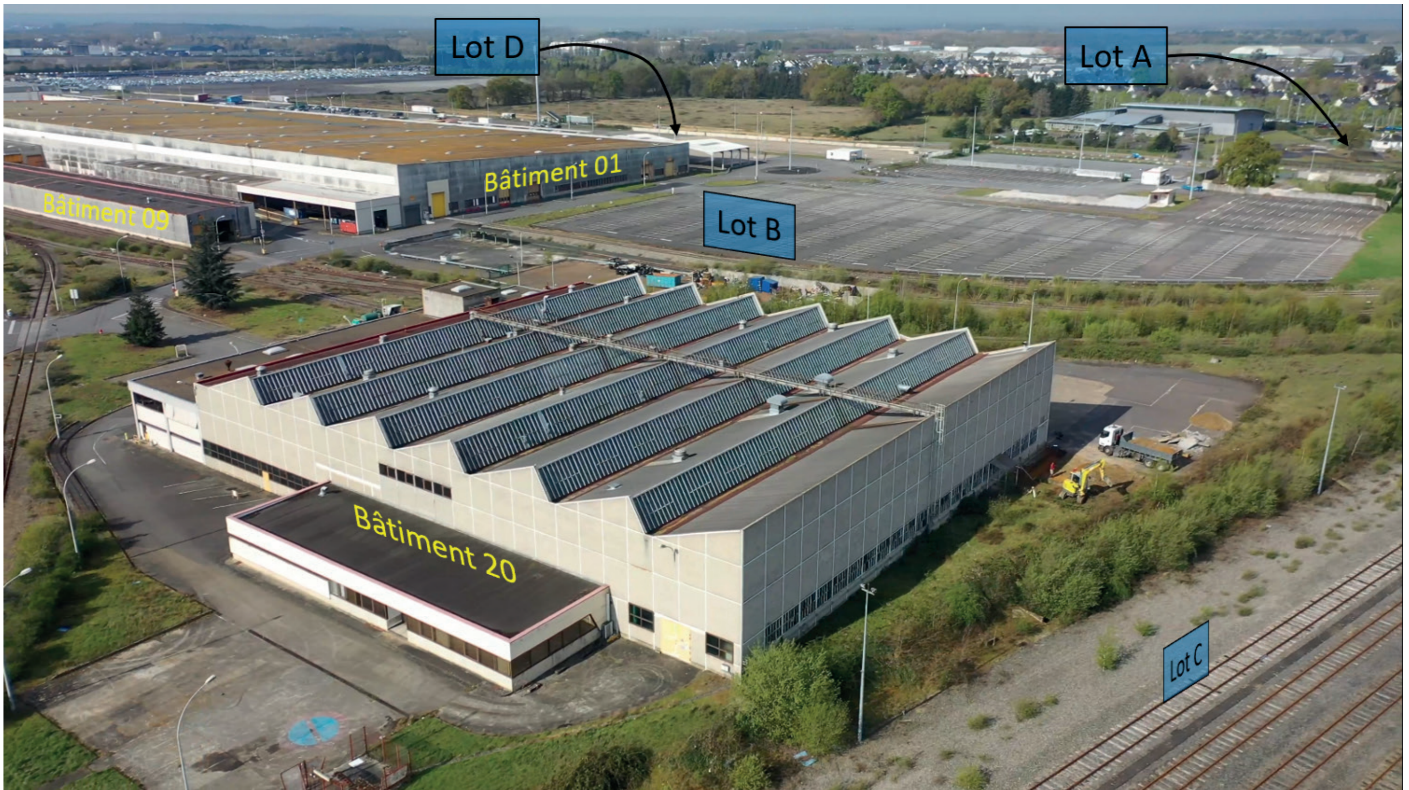
Figure 61 : Zone d'étude - Etat initial - Juin 2021